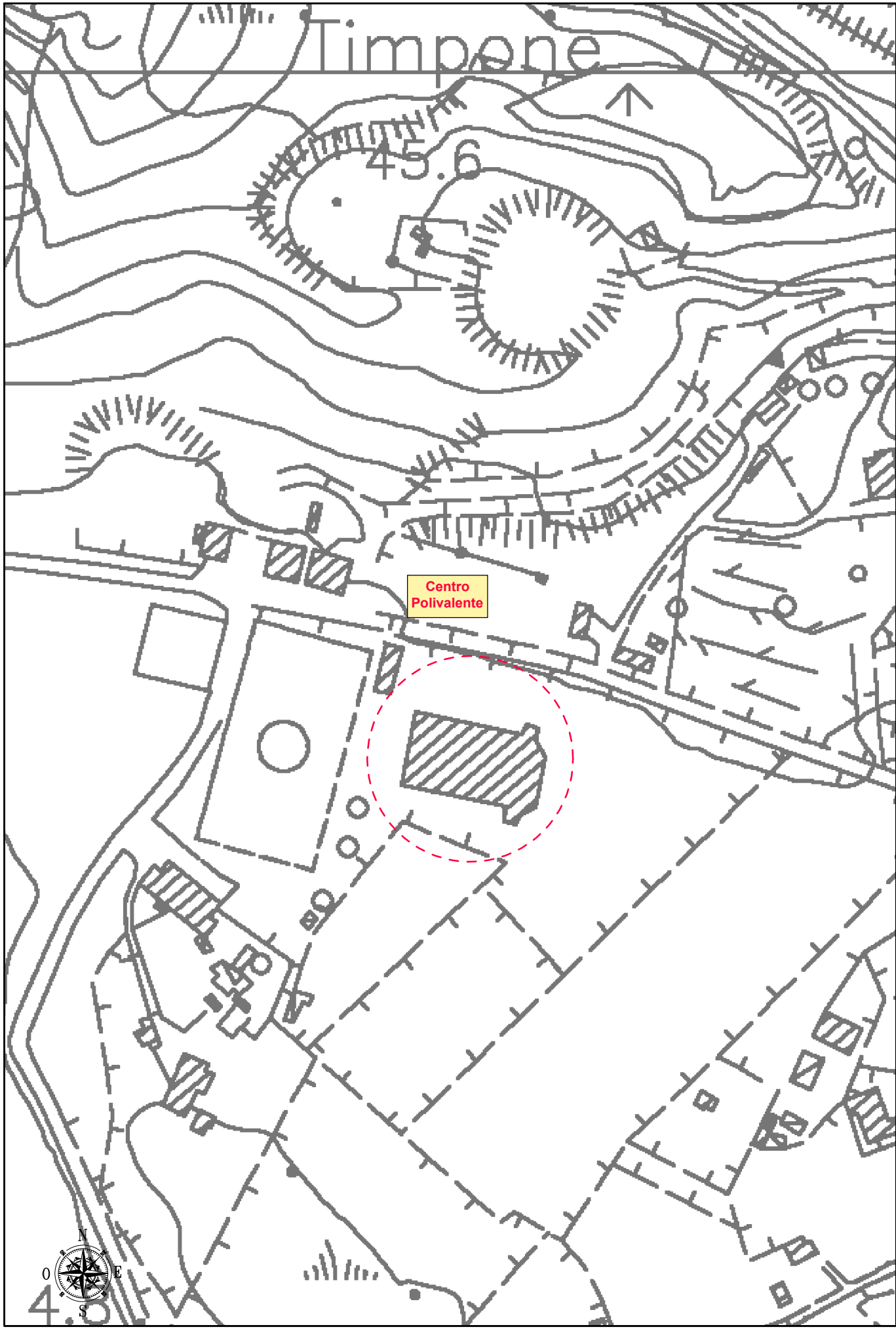
COMUNE DI LAMPEDUSA E LINOSA - AEROFOTOGRAMMETRIA Scala 1:2.000