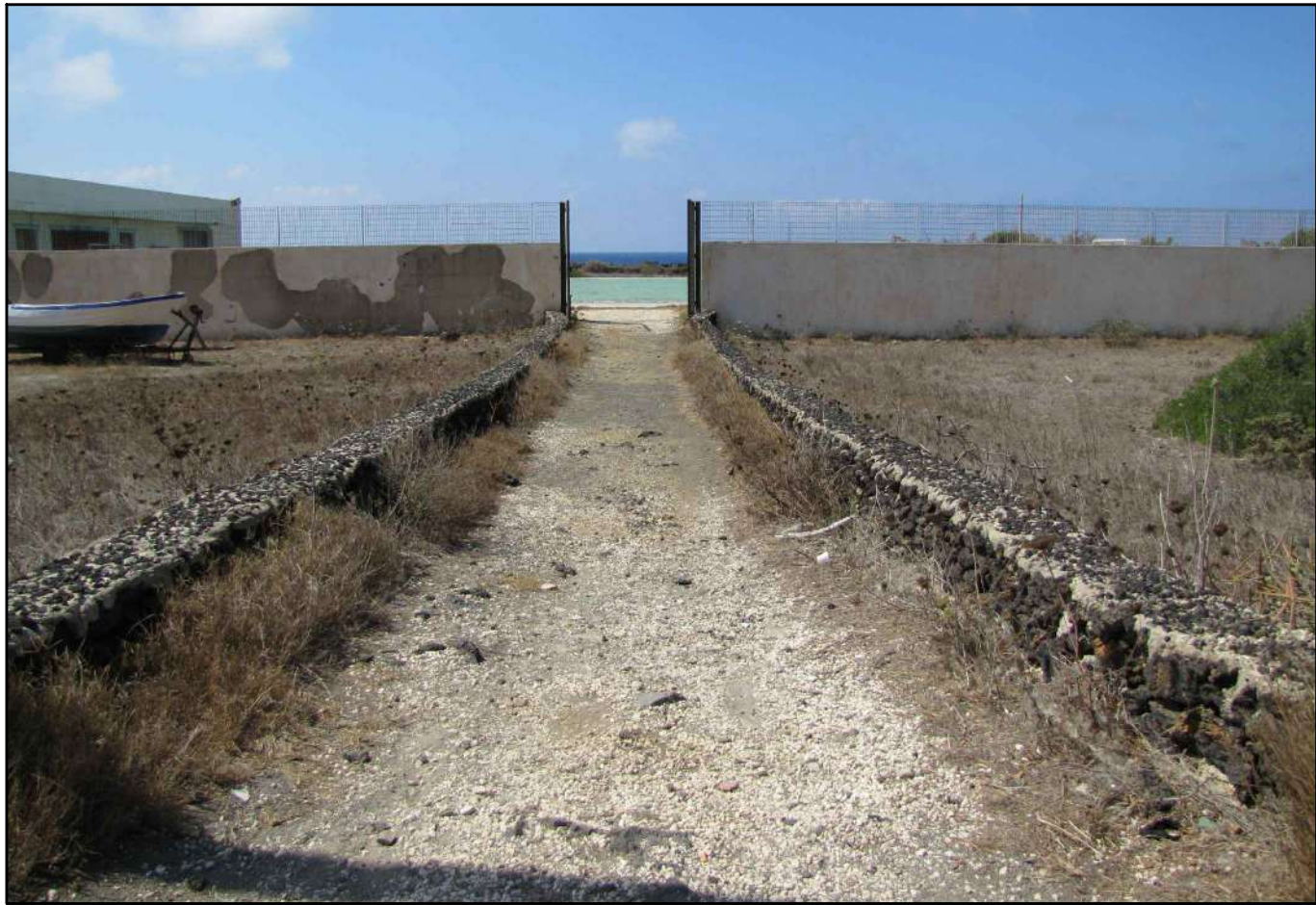
REPERTORIO FOTOGRAFICO - Foto 2