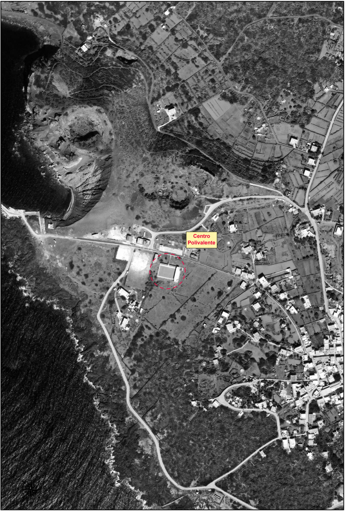
ORTOFOTO - Scala 1:5.000