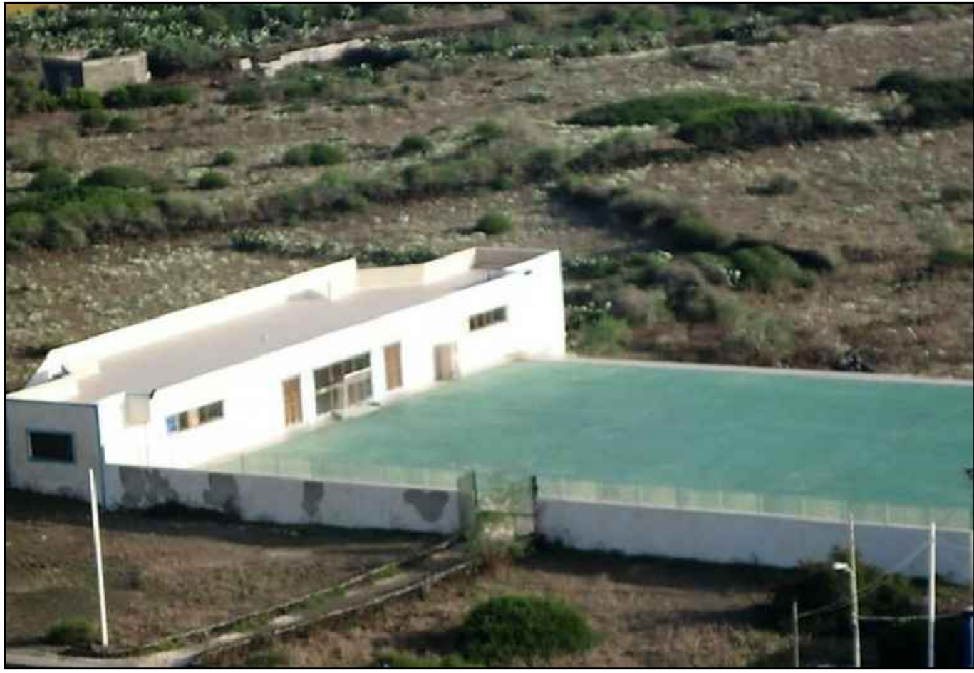
REPERTORIO FOTOGRAFICO - Foto 1